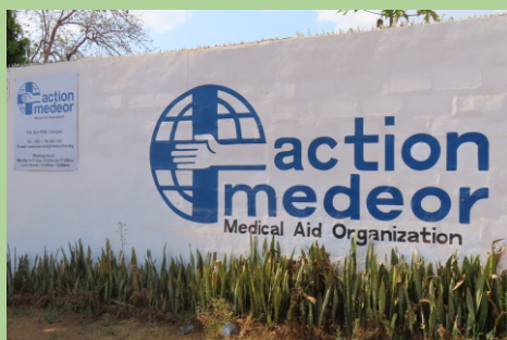
Das Deutsche Medikamenten- Hilfswerk action medeor e.V. stellt uns wiederum Arzneimittel i.H. von 2000 € für unsere Village Clinics zur Verfügung, danke.